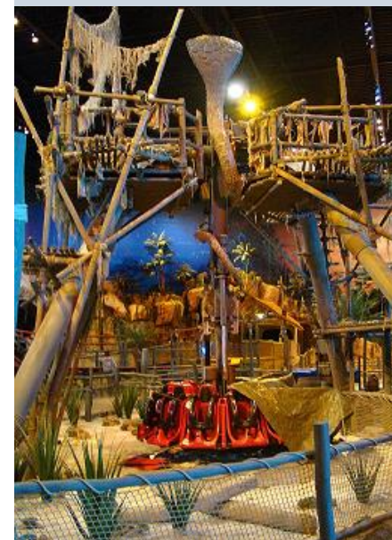
Unieke Plopsa-attractie in Coevorden

met mooie prijzen. Op het gebied van attracties zal het park in het noorden van Nederland erg veel gelijkenissen hebben met Indoor Hasselt. Zo zijn de publieksfavorieten als 'De Vuurtoren' en 'De carrousel' zeker van de partij, maar voor ons als credit-hunters opent het park ook een coaster: De Piratenbaan! Naast deze razendsnelle achtbaan is er nog meer actie in Coevorden in de vorm van een Mini Discovery van Zamperla, een unicum voor een Plopsa-park!