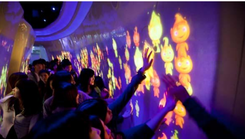
Innovatief nieuw wachtrijvermaak bij Space Fantasy