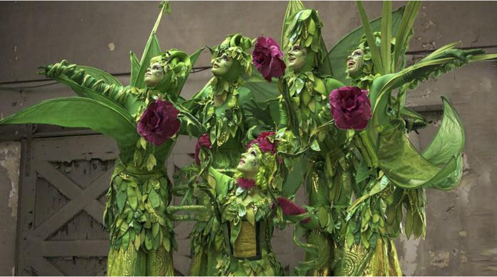
Eén van de vele acts tijdens het Fantasy Festival