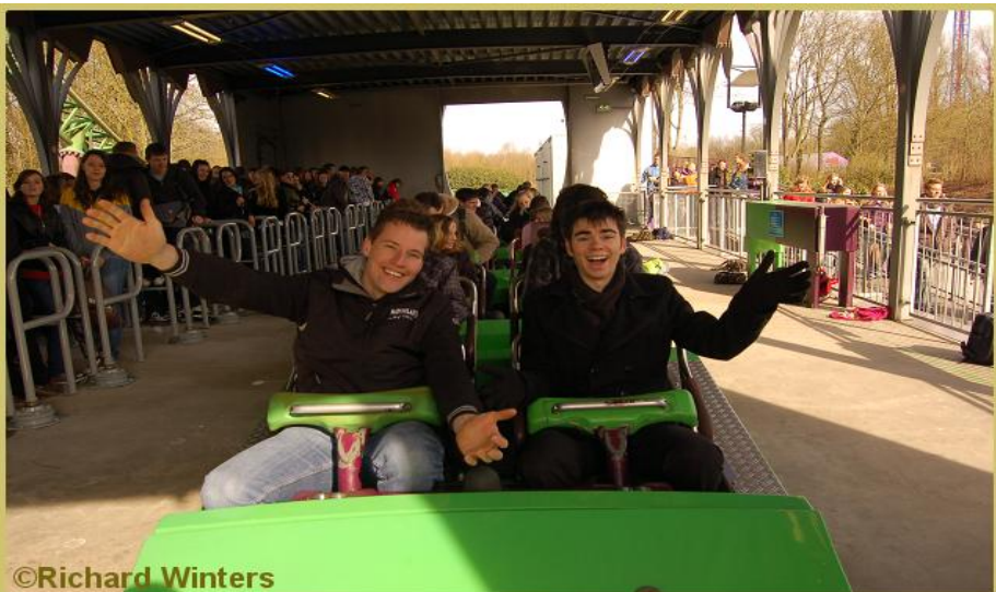
Dolkomisch entertainment-duo maakt opening Walibi World geslaagd