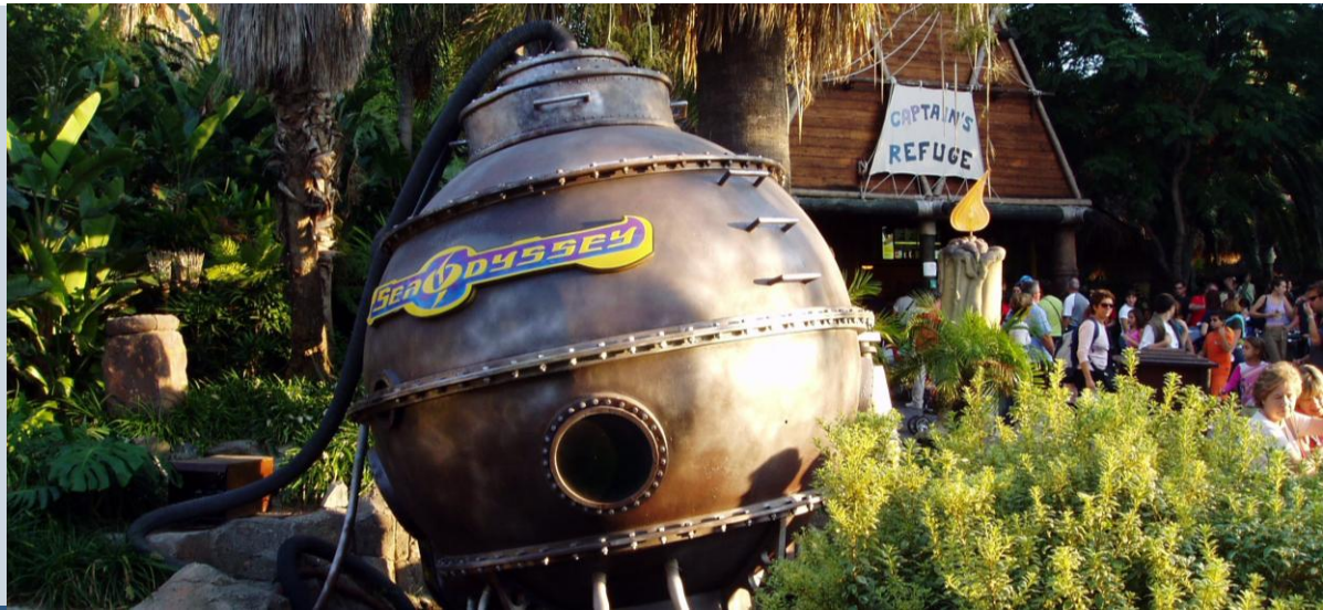
Sea Odyssey: schitterende omgeving, matige attractie