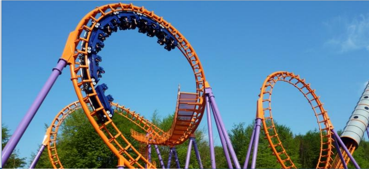
Speed of Sound is sinds de heropening razendpopulair

“Populariteit en bekendheid van Intellectual Properties moeten aansluiten bij je parkstrategie!”