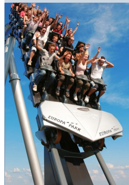
Silver Star is één van de attracties van de vele attracties van Europa-Park.

Met dit nieuwe tv-programma probeert de Efteling de sprookjessfeer van het park bij de kijker thuis te brengen. En voor RTL is het park een ideale partner om dit nieuwe concept op te zetten. De Efteling zet zich met deze nieuwe samenwerking nog beter dan tevoren op de kaart in de massamedia. Eerder al werkte het park samen met de publieke omroepen. De series Sprookjesboom, De Grobbollen maken lol, TitaTovenaar en De sprookjes van Klaas Vaak waren hiervan het resultaat. De komende jaren heeft de Efteling meer verrassende producties in de planning.