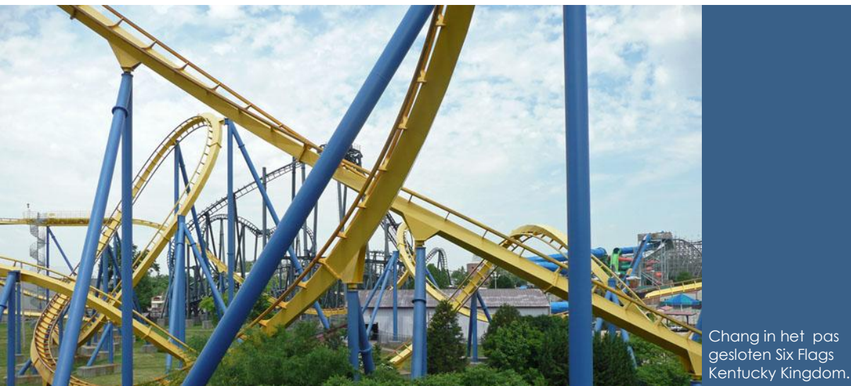
Chang in het pas gesloten Six Flags Kentucky Kingdom.