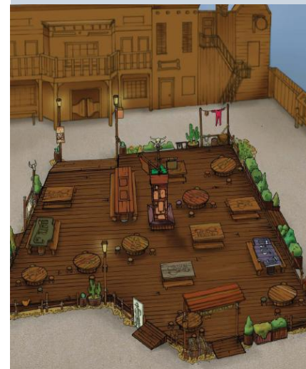
Gezelligheid in the Wild Wild West: een lekkere versnapering op het nieuwe Western Terrace