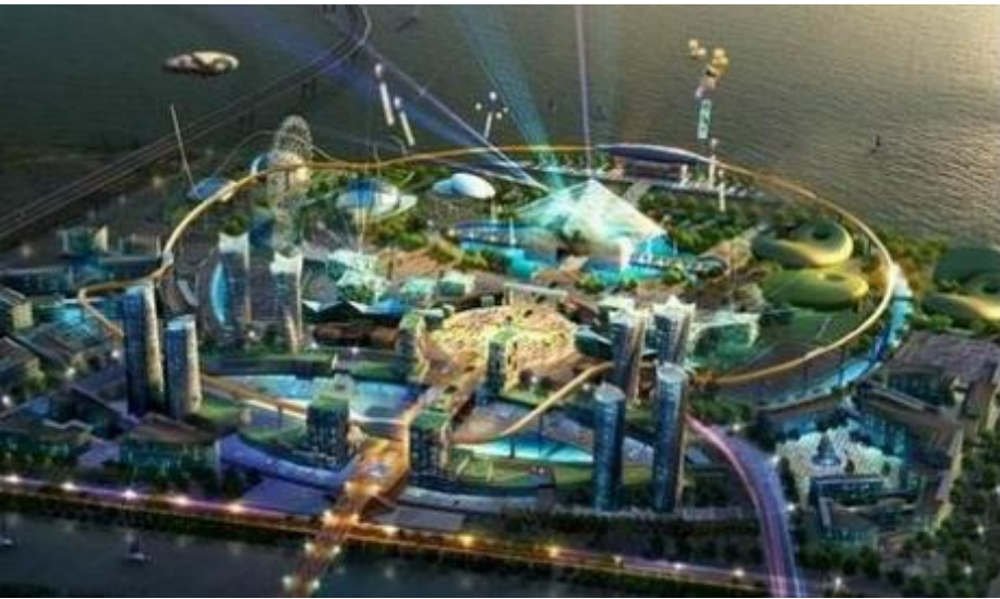
Concept van Robot Land, het futuristische themapark dat in Korea zal komen