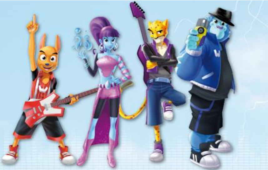
Walibi en zijn kornuiten