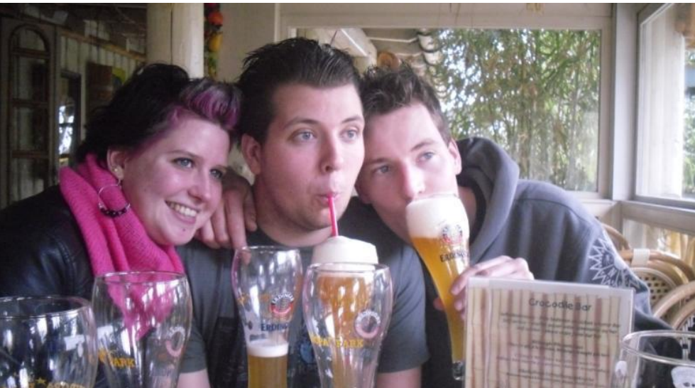
Bierestaffette in het geliefde Duitse Europa-Park.