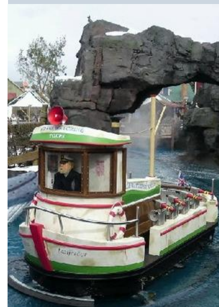
Eén der walvisvaarders

De grote nieuwe attractie ligt even verderop: Whale Adventures – Splash Tours. De wachtrij van deze waterattractie voert bezoekers naar een bezoekerscentrum alwaar kaartjes te krijgen zijn voor boottochten langs de walvissen. Eenmaal aan boord komen de avonturiers ook in aanraking met papegaaiduikers, zeeleeuwen en andere dieren. Bezoekers aan de kant hebben diverse uitzichtpunten, vanaf bijvoorbeeld de grote vuurtoren.